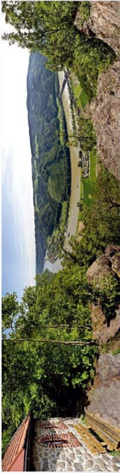
Blick vom Ebenstein übers Donautal ins benachbarte oberösterreichische Innviertel