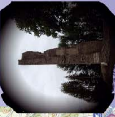
Burgruine Neujochenstein bei Riedl

... kostenlos erhältlich bei: www.donau-perlen.de