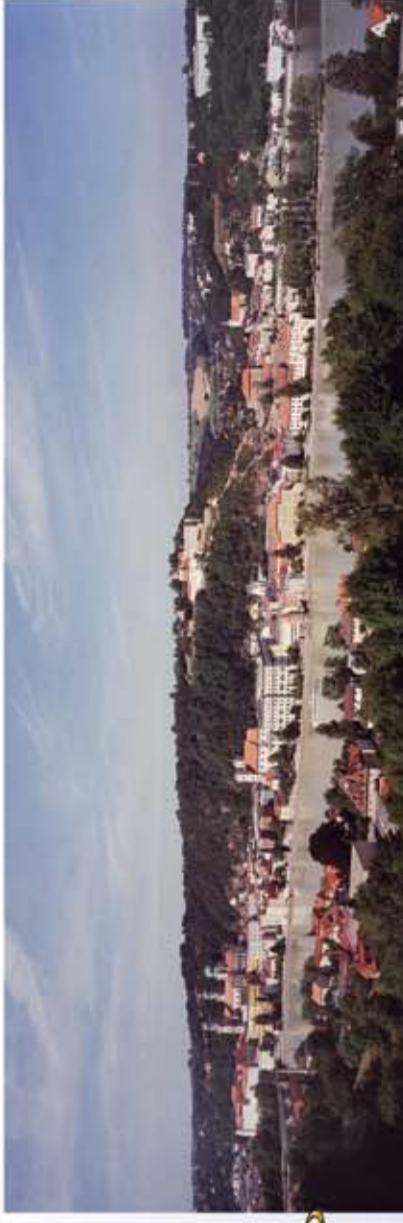
Blick auf die Dreiflüssestadt Passau

Anbindungen an die bekannten Wanderwege *Goldsteig und *Jakobsweg